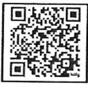
หลักเกณฑ์และวิธีการให้กู้ยืม เงินทุนหมุนเวียนฯ พ.ศ. 2567

ให้กู้ยืมรายละไม่เกิน 700,000 บาท ดอกเบี้ยร้อยละ 4 ต่อปี ผ่อนชำระคืน 13 ปี (156 งวด)