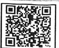
ตาราง การผ่อนชำระหนี้