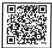
เอกสาร ประกอบคำขอกู้ยืม